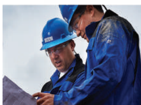
Controllo delle prestazioni