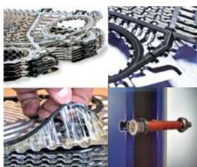
Sostituzione delle guarnizioni e altre parti di ricambio