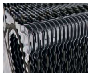
Riassemblaggio del pacco piastre