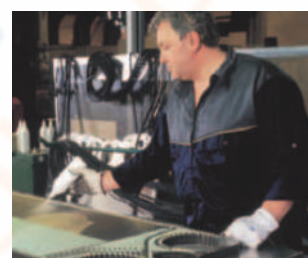
Pulizia e ricondizionamento delle piastre