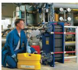
Prova finale di tenuta